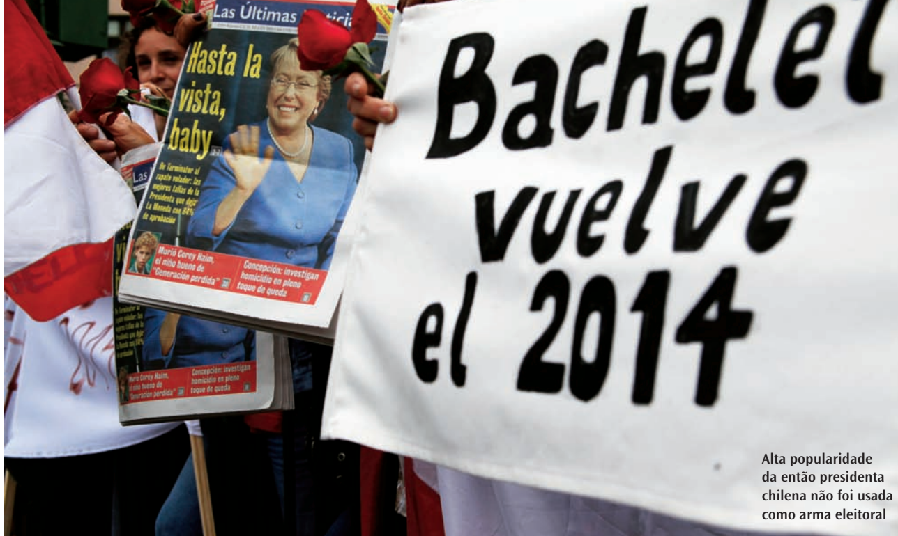
Alta popularidade da então presidenta chilena não foi usada como arma eleitoral