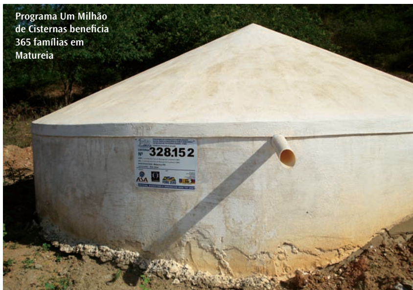
Programa Um Milhão de Cisternas beneficia 365 famílias em Matureia